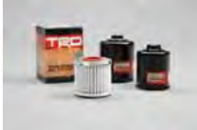
Filtro de aceite TRD $13 MSRP de las partes solamente**