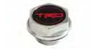
Tapa de aceite TRD $45 MSRP de las partes solamente**