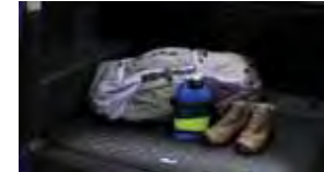
Tapetes para todo clima para el área de carga $79 MSRP de las partes solamente**