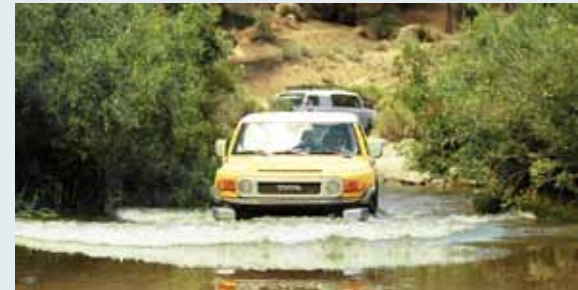
Se muestra la FJ Cruiser en color Sun Fusion y Silver Fresco Metalic con estribos protectores opcionales