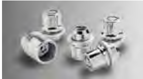
Trabas para ruedas de aleación $81 MSRP instalado*