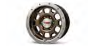
Ruedas con bulones de acero TRD de 16 plg. para campo traviesa $219 MSRP de las partes solamente**