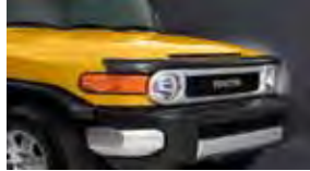
Protector frontal $155 MSRP instalado*