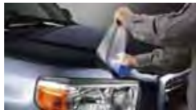
Película de protección para la pintura $395 MSRP instalado*