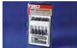
Trabas para ruedas TRD $150 MSRP de las partes solamente**