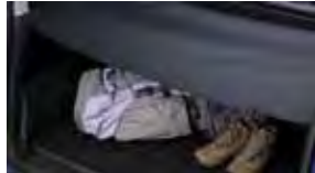
Cobertura para carga $90 MSRP instalado*