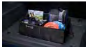
Bolsón para la carga $40 MSRP de las partes solamente**