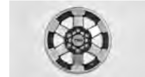
Ruedas de aleación TRD de 16 plg. y 6 Rayos & LT265/75R16 BFG Todo terreno T/A KO con seguros para ruedas y de repuesto $1,899 MSRP instalado*