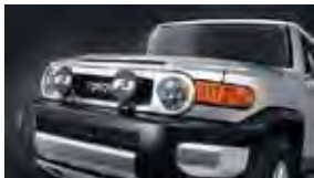
Luces auxiliares $475MSRP de las partes solamente**