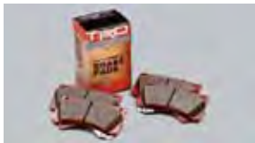
Almohadillas de freno con rendimiento TRD $95 MSRP de las partes solamente**