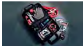
Equipo de asistencia para emergencias $70 MSRP instalado*