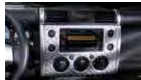
Aplicaciones moldeadas en el tablero $350 Installed MSRP*