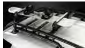
Anclaje para esquíes $224 MSRP de las partes solamente**