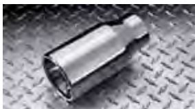
Punta del caño de escape $75 MSRP instalado*