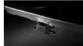
Gancho de remolque y arnés para cables $349 MSRP instalado*