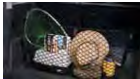
Red de carga $49 MSRP instalado*