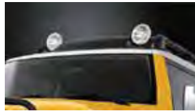
Luces para el manejo Off-Road con deflector de aire $799 MSRP instalado*