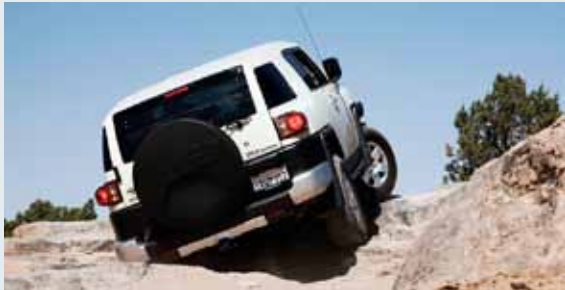
Se muestra la FJ Cruiser en color Iceberg con Paquete Upgrade #2 disponible [6]