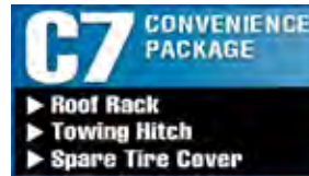
Portaequipaje, gancho de remolque y arnés para cables y carcasa de la rueda de auxilio