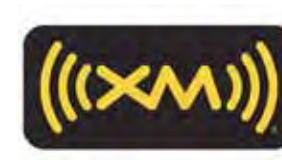
Radio satelital XM $449 MSRP instalado*