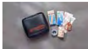
Equipo de primeros auxilios $29 MSRP instalado*