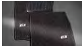
Tapetes alfombrados para el piso y el área de carga $199 MSRP instalado*