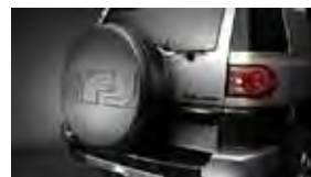
Carcasa de la rueda de auxilio $169 MSRP instalado*