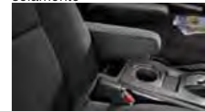
Apoyabrazos $125 MSRP instalado*