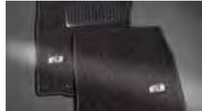
Tapetes alfombrados (set de 4 piezas) $119 MSRP de las partes solamente**