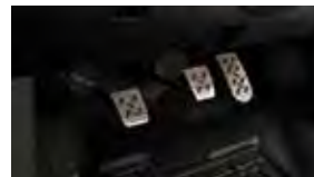
Pedales deportivos $85 MSRP instalado*