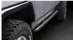
Estribos protectores $575 MSRP instalado*