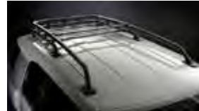
Portaequipaje $649 MSRP instalado*