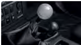
Palanca rápida de cambios TRD $450 MSRP instalado*