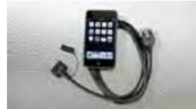
Equipo de interfaz para iPod® $299 MSRP instalado*