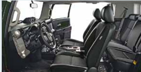
Se muestra el interior de la FJ Cruiser 4WD en Dark Charcoal con Paquete Upgrade #2 disponible [6]