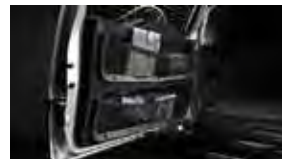
Red de carga para la puerta trasera $89 MSRP instalado*