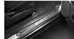
Umbral pulido $149 MSRP instalado*