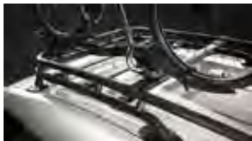
Accesorio para sujetar bicicletas $274 MSRP de las partes solamente**