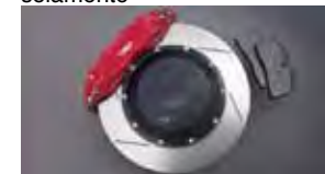
Conjunto de frenos TRD de alto rendimiento $2,195 MSRP instalado*