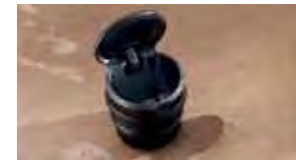
Cenicero $17 MSRP de las partes solamente**