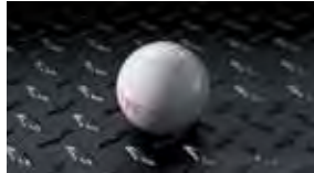
Palanca de cambio TRD $59 MSRP instalado*