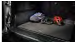
Tapetes alfombrados para el área de carga $69 MSRP de las partes solamente**