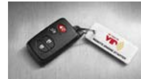
Arranque del motor a distancia $529 MSRP instalado*