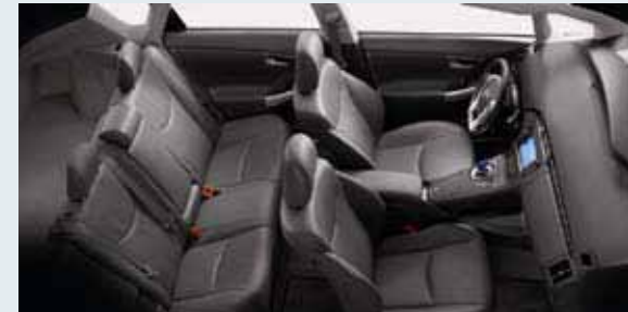
Se muestra interior del Prius IV en piel color Dark Gray con Paquete Tecnología Avanzada disponible [27]