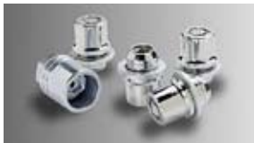
Trabas para las ruedas (de aleación) $67 MSRP instalado*