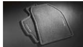
Tapetes para el piso y la carga $200 MSRP instalado*