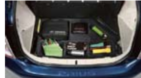
Organizador del área de carga $49 MSRP instalado*