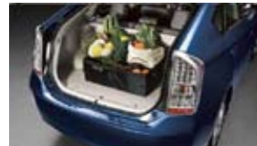
Bolso grande de carga de Nifty Products $40 MSRP instalado*