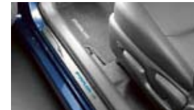
Soleras iluminadas para las puertas $359 MSRP instalado*