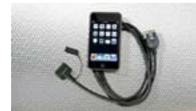
Equipo de interfaz para iPod® $299 MSRP instalado*