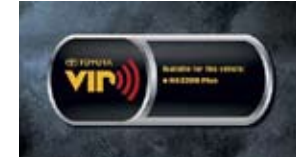
Sistema de seguridad VIP RS3200 plus $359 MSRP instalado*