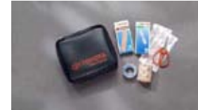
Equipo de primeros auxilios $29 MSRP instalado*