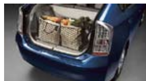
Red de carga $51 MSRP instalado*