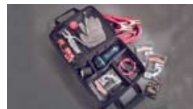
Equipo de asistencia para emergencias $70 MSRP instalado*