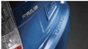
Aplicación para el paragolpes trasero $69 MSRP instalado*