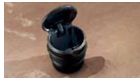
Cenicero $17 **MSRP de las partes solamente