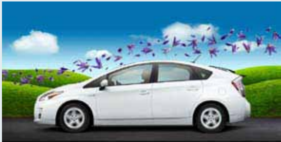
Se muestra el Prius IV en color Blizzard Pearl con Paquete Techo Solar disponible [1] (Disponible en Prius III y IV solamente)