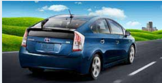
Se muestra el Prius V en color Blue Ribbon Metallic con Paquete Tecnología Avanzada disponible [27]