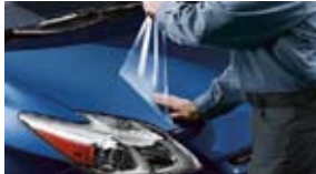
Película de protección en la pintura $395 MSRP instalado*